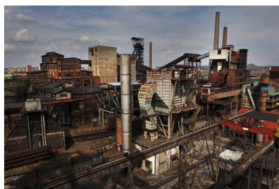
Dolní oblast Vítkovic

První ročník odborného veletrhu „inteligentních energií“, zaměřeného na využití alternativních zdrojů energie energetické úspory obecně. Bohatý doprovodný program (fotovoltaika, bioplyn, energie větru atd.). Veletrh má být místem setkání a výměny zkušeností odborníků regionu Odra-Nisa. www.inenerg.com