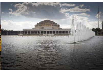
Wroclaw – Hala století